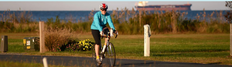
Montando bicicleta en la Bahía de Chesapeake.

¡EL CAMINO ES PARA TI! CAMINA, CORRE Y MONTA EN BICICLETA CON TU FAMILIA Y AMIGOS!