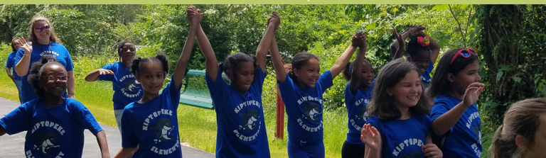
Estudiantes de la Escuela Primaria Kiptopeke en el Southern Tip Bike and Hike Trail.